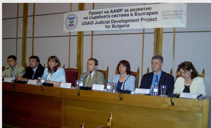
21 юни 2004 г. Конференция в резиденция „Бояна“ „Реформата в гражданското производство: нуждата от изменение на ГПК и намаляване забавянето при делата“