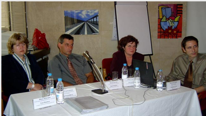
16 август 2003 г. Представяне на Автоматизираната система за управление на делата в Благоевград

В тази нова рубрика се надяваме да предизвикаме усмивки, връщайки Ви към общите ни спомени от 2002 г. насам. Екипът на ПРСС ще се радва да получи Ваши снимки от събития, обучения, дискусии, пътувания през годините и да Ви припомни историята ни.